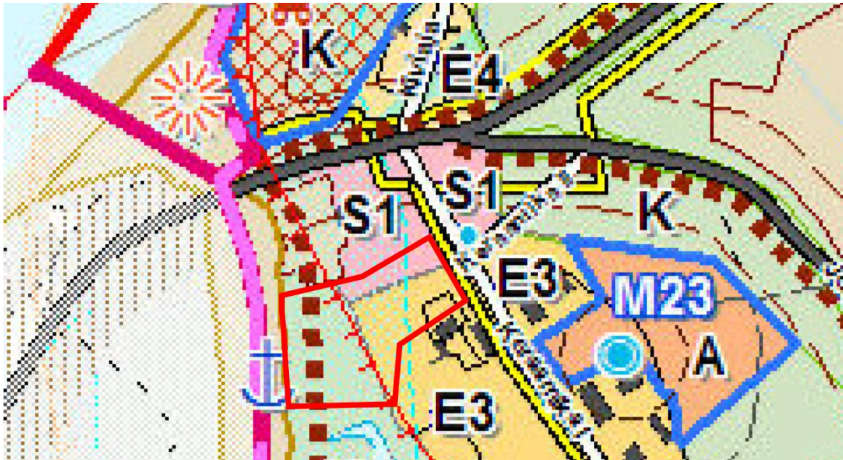
Joonis 3 Väljavõte Audru valla üldplaneeringu kaardist

Üldplaneeringu kohaselt on elamualale E3 lubatud planeerida kuni 2-korruselised elamud.