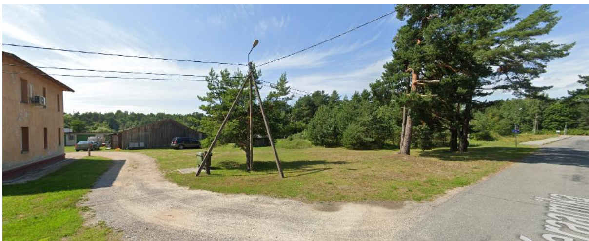
Joonis 2 Vaade Keraamika tn 3 kinnistule

Võrreldes teiste piirkonna kinnistutega on Keraamika tn 3 suurema pindalaga. Kinnistu ulatub Reiu jõe äärde välja olles kujult jõe poolses osas laiem kui Keraamika tänava ääres. Piirkonna hoonestus paikneb valdavalt Keraamika tänava ääres. Hoonestuse moodustavad nii korterelamud, kui ka üksikelamud. Keraamika tn 7, 9, 10 ja 21 kinnistutel paiknevad olemasolevad viilkatusega kortermajad. Ülejäänud kruntidel on valdavalt ühekorruselised üksikelamud.